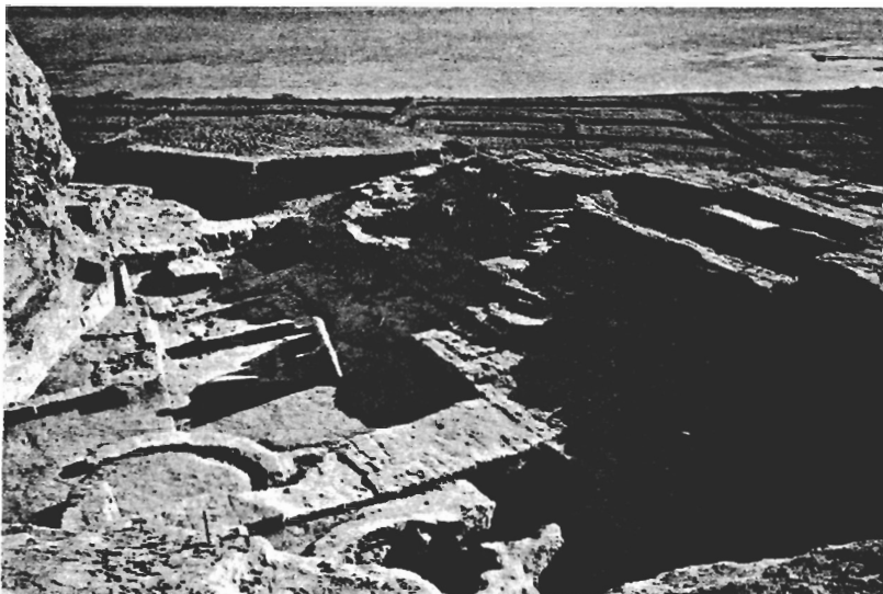
Abb. 5. Tall 'Ašara-Terqa, Stadtmauer